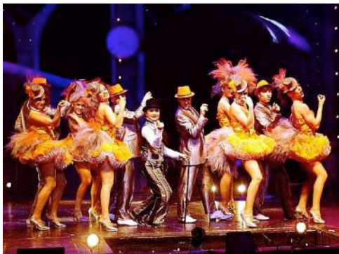
La Flambée Ballet · França

A més de 12 metres d'alçada, els vols al trapezi d'aquesta jove artista dibuixen trajectòries brillants. El seu somriure permanent dona una falsa sensació de facilitat en el seu repte a volar pel damunt de la pista oferint salts, piruetes i recepcions de gran dificultat.