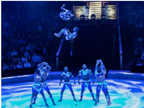
Troupe Afrika Volteig acrobàtic · Etiòpia

Aquesta jove artista executa un número on força física i flexibilitat es combinen oferint una col·lecció de proeses acrobàtiques aèries de gran plasticitat i bellesa. Una elegància que a voltes fa oblidar el risc real que comporten les atraccions d'aquest tipus que s'efectuen sense cap tipus de protecció.