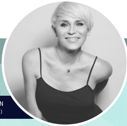
ANTONIA SAN JUAN (AUTORA Y DIRECTORA)

LO MALO DE SER PERFECTO es el último trabajo de esta Compañía de Teatro, que ha producido y distribuido ya varios montajes en España, Europa y Latinoamérica. Grandes éxitos de crítica y público como los aclamados OTRAS MUJERES y LAS QUE FALTABAN, interpretadas ambas por Antonia San Juan, EL VENENO DEL TEATRO, adaptación del texto del dramaturgo Rodolf Sirera, y los divertidos montajes HOMBRES... Y ALGUNA MUJER y ¡A TIROSI son algunas de las producciones que se han realizado. Con esta imparable carrera continúa en el proceso de creación de nuevos espectáculos. En cartel en estos momentos se pueden ver LO MEJOR DE ANTONIA SAN JUAN y DE CINTURA PARA ABAJO.